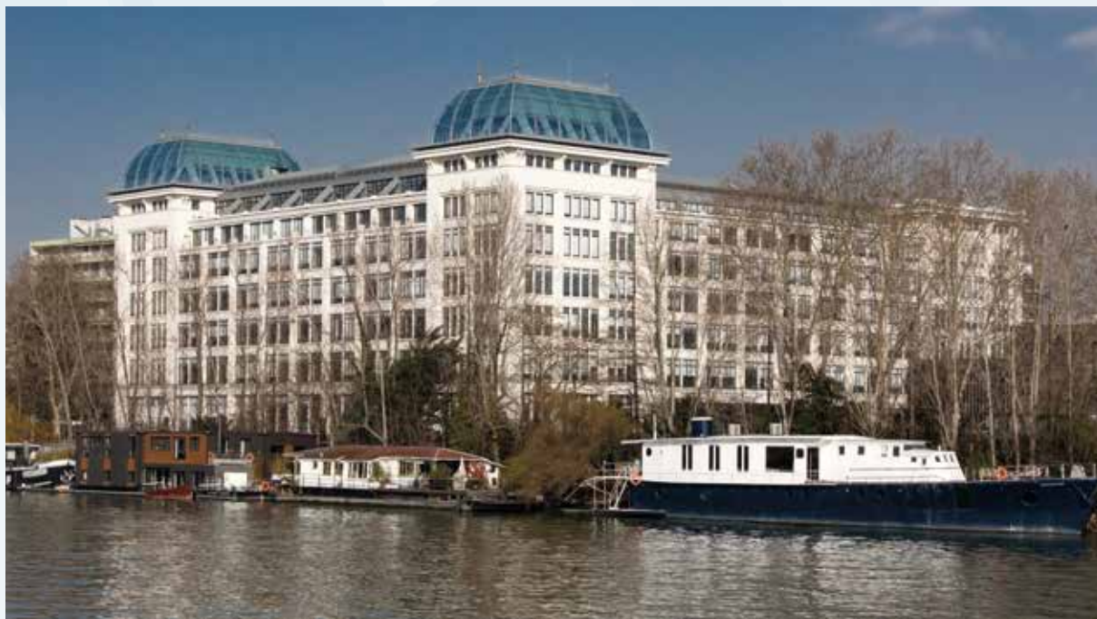
📍 Bureaux de l'OCDE à Boulogne-Billancourt, près de Paris.