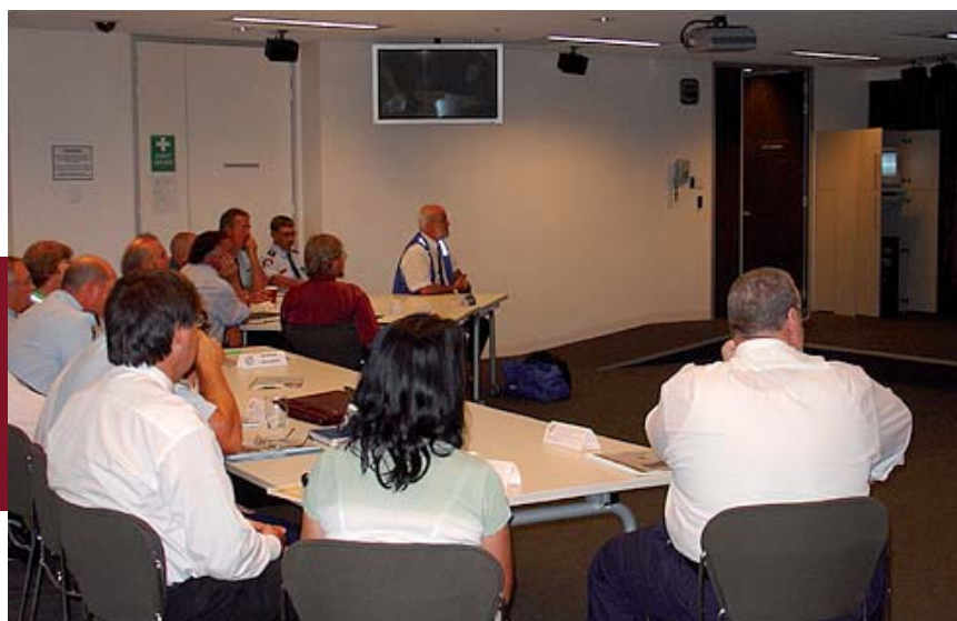
Exercice Socrates au poste de police avec des proviseurs du secondaire