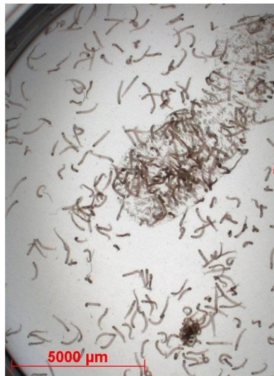
Figure 2 : larves de premier stade provenant d'un amas d'œufs de C. riparius presque entièrement éclos (21)