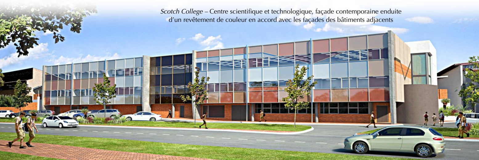
Scotch College – Centre scientifique et technologique, façade contemporaine enduite d'un revêtement de couleur en accord avec les façades des bâtiments adjacents

Lorsque l'on conçoit un nouveau bâtiment scolaire, on crée non seulement des murs, mais également une nouvelle communauté. L'apprentissage est en effet un processus social qui s'inscrit dans un environnement physique ; la manière dont est conçu cet espace peut donc contribuer de façon décisive à faire naître une culture de l'excellence chez les élèves, en d'autres termes les inciter à participer activement au processus d'apprentissage. Par définition, les élèves interagissent et forment, par leurs interactions, une communauté à part entière.