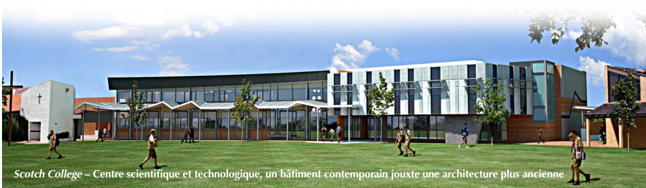
Scotch College – Centre scientifique et technologique, un bâtiment contemporain jouxte une architecture plus ancienne

De plus, chaque aspect du projet (installations, planning, forme et structure des bâtiments, finitions, technologies embarquées, adaptabilité et flexibilité, site d'implantation ou encore durabilité) doit permettre aux bâtiments, une fois les travaux achevés, de promouvoir au mieux – voire d'améliorer – l'environnement scolaire dans son ensemble.