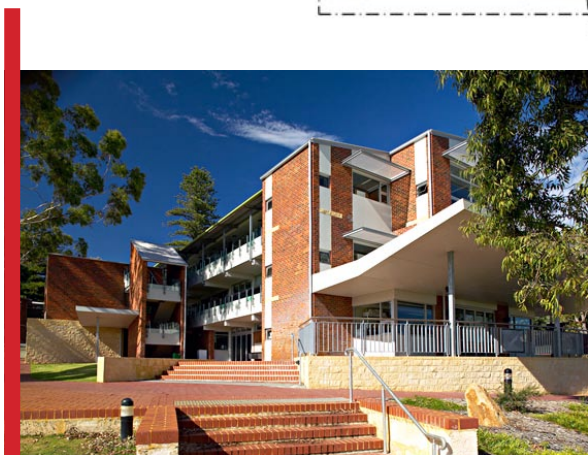
Scotch College – École primaire de 2 nd cycle, reconversion d'un bâtiment datant des années 1960