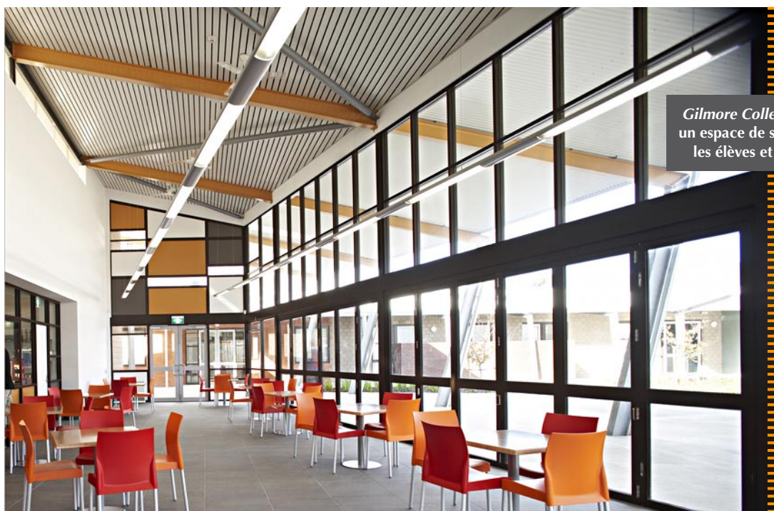
Gilmore College – cafeteria, un espace de sociabilité pour les élèves et le personnel