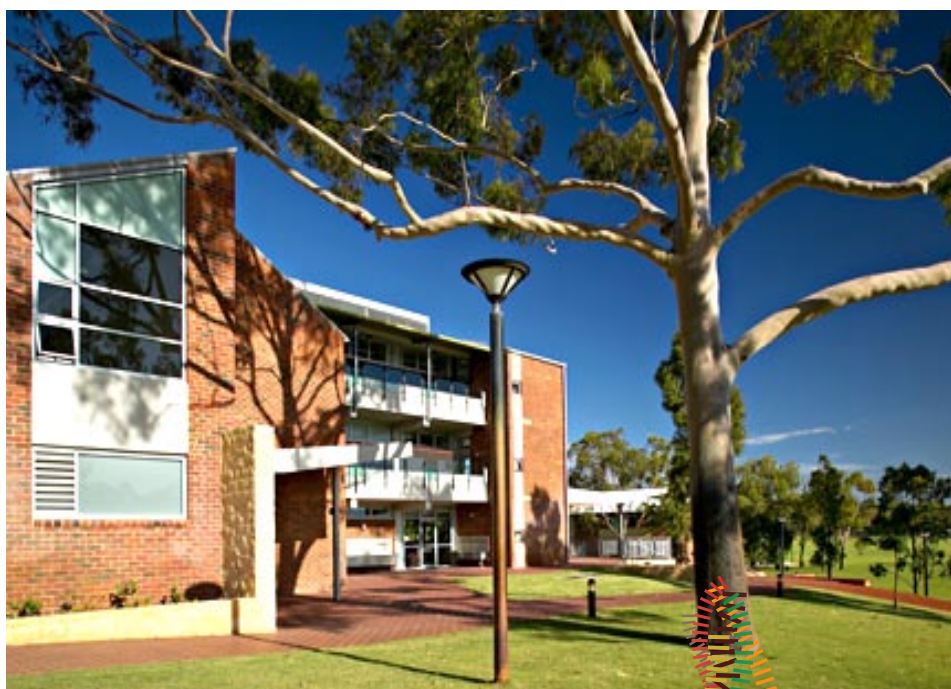
Scotch College – École primaire 2 nd cycle, un pensionnat reconverti en environnement d'apprentissage contemporain

Puisque les contraintes et exigences qui pèsent sur les bâtiments ne cessent d'évoluer, les infrastructures scolaires doivent, pour répondre aux attentes énoncées, être adaptables et flexibles, pour pouvoir à la fois suivre le progrès technologique et répondre aux besoins et impératifs changeants des groupes d'utilisateurs et de la communauté dans son ensemble.