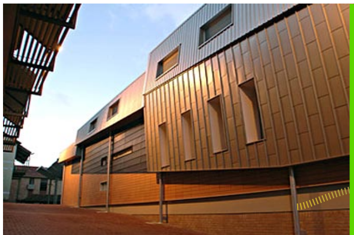
Scotch College – Centre Dickinson, finitions modernes, besoins de maintenance limités et matériaux résistants

Les infrastructures scolaires doivent résister à un degré d'usure important. Les matériaux de construction et finitions employés doivent donc être choisis avec soin, de façon à minimiser les besoins de maintenance et à garantir la pérennité de l'environnement physique.