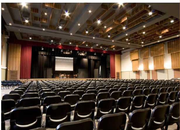
Scotch College – Centre Dickinson, espace dédié aux arts contemporains

Sur les clichés qui accompagnent cet article, on peut voir plusieurs exemples d'installations éducatives aménagées à Perth (Australie Occidentale) dans le domaine de l'enseignement primaire et secondaire. Ces établissements exemplaires montrent à quel point l'architecture peut contribuer à créer des environnements pédagogiques stimulants ainsi qu'une véritable culture de l'excellence chez les élèves.