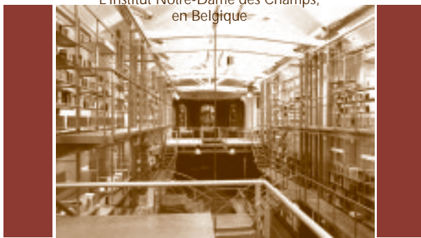
L'Institut Notre-Dame des Champs, en Belgique