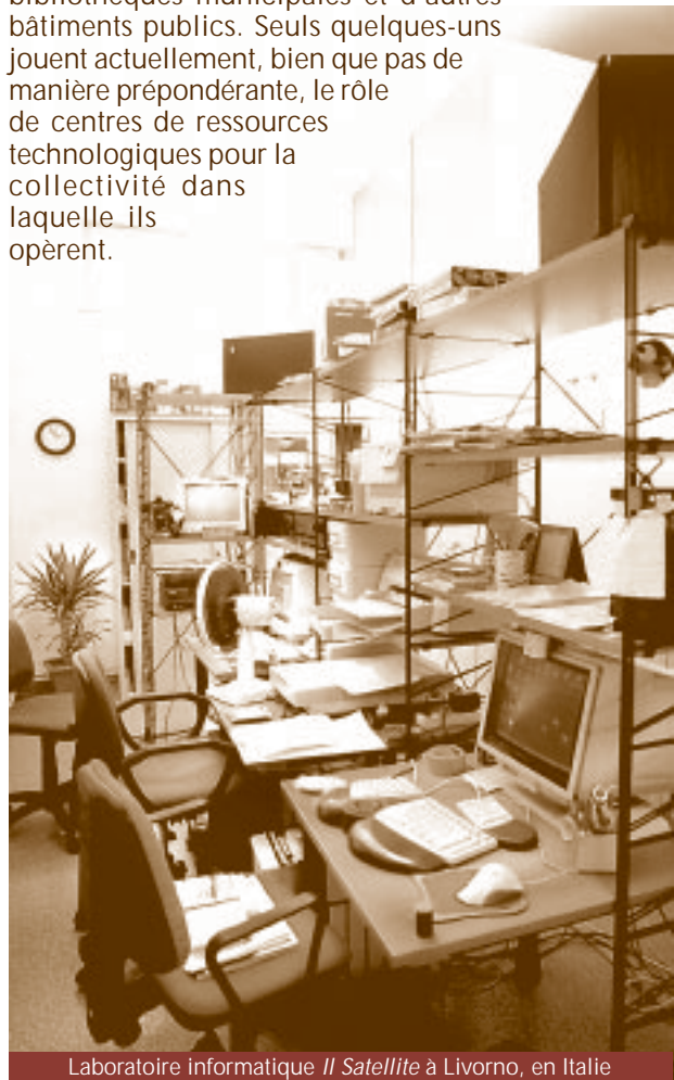
Laboratoire informatique Il Satellite à Livorno, en Italie

Les centres sont placés dans des écoles, des bibliothèques municipales et d'autres bâtiments publics. Seuls quelques-uns jouent actuellement, bien que pas de manière prépondérante, le rôle de centres de ressources technologiques pour la collectivité dans laquelle ils opèrent.