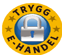
Figure 2. Exemple de marque de confiance : Svensk Distanshandel, en Suède