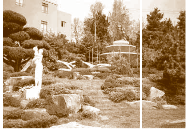
Entrée du « jardin des senteurs » de l'école secondaire de filles Gochang dans la province du Cholla du Nord