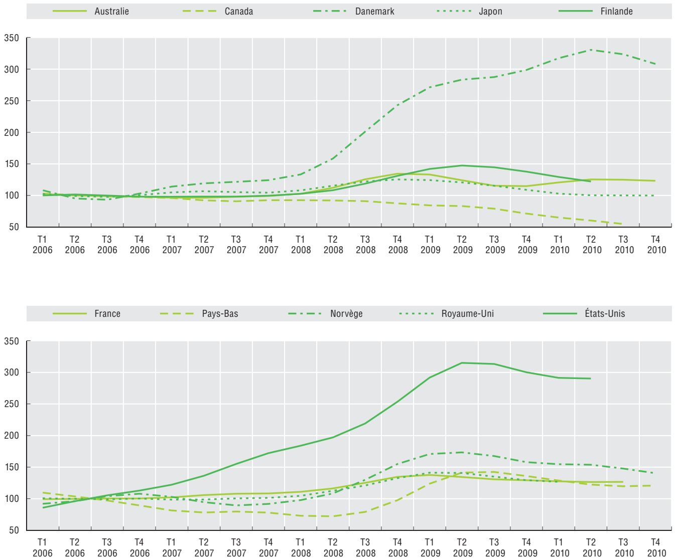
Graphique 16.1. Nombre de faillites, moyenne 2006 = 100, tendance-cycle