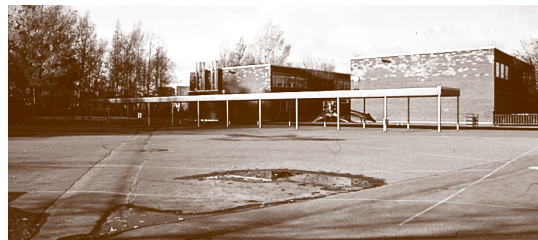
La cour d'une école primaire à Helsinki – un lieu qui n'a rien d'inspirant où l'asphalte est la seule matière utilisée

Pour toute information complémentaire, contacter : Reino Tapaninen Architecte en chef National Board of Education PO Box 380 FIN-00531 Helsinki Tél. : 358 9 77477121, télécopie : 358 9 77477197 reino.tapaninen@oph.fi