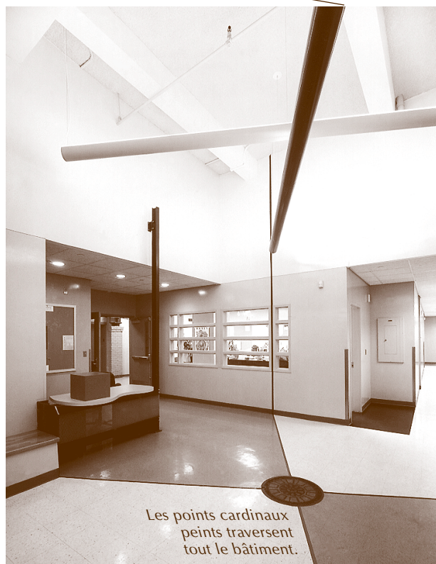
Les points cardinaux peints traversent tout le bâtiment.