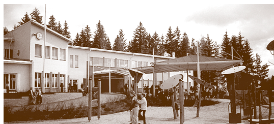
Le terrain d'un collège à Mäntsälä, où l'on a tenu compte de l'âge et des besoins des élèves