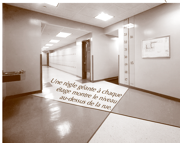
Une règle géante à chaque étage montre le niveau au-dessus de la rue.